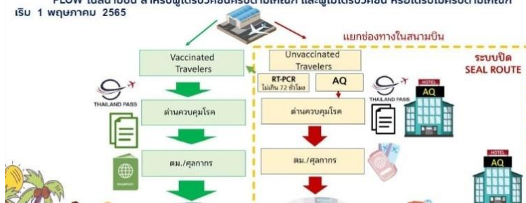
FLOW ในสนามบิน สำหรับผู้ได้รับวัคซีนครบตามเกณฑ์ และผู้ไม่ได้รับวัคซีน หรือได้รับไม่ครบตามเกณฑ์ เริ่ม 1 พฤษภาคม 2565